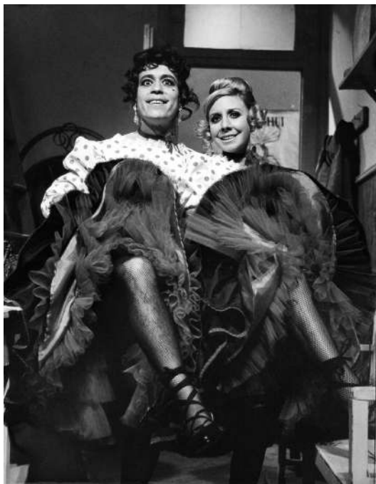
José Luis López Vázquez con Gracita Morales en Objetivo: BI-KI-NI.

La carrera de López Vázquez está directamente vinculada a la de otras grandes figuras de la cinematografía española. Actrices míticas como Gracita Morales , el guionista por antonomasia Rafael Azcona o directores como Luis García Berlanga y Carlos Saura .