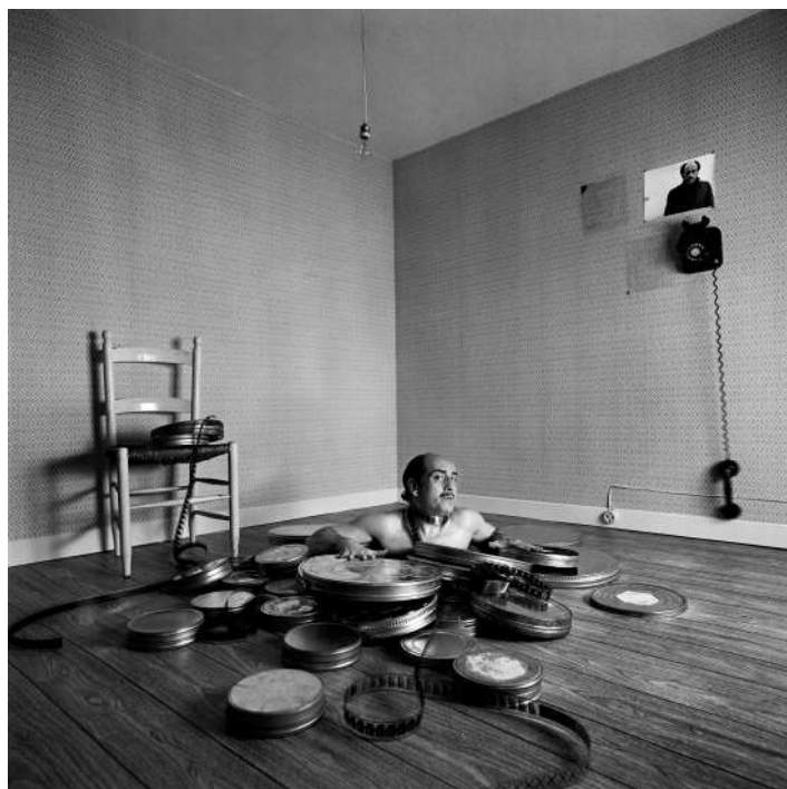
Albert Schommer. Retratos psicológicos (1969 -1973)

López Vázquez está sepultado entre cintas de películas. En la pared aparece una foto de uno de sus personajes dramáticos y además hay un teléfono descolgado que nos habla de una de sus películas famosas, La cabina.